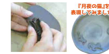
『月夜の猫』を表現してみました♡