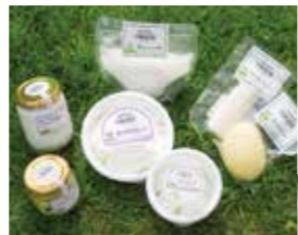
「kotobuki cheese」のチーズ商品や、カフェで提供しているフグレンのコーヒー豆も販売

店内には、螺旋階段を登った先に2階席があり、白を基調としたモダンで洗練された空間が広がります。北欧テイストのインテリアが特徴で、シンプルながらも温かみのある雰囲気。大きな窓から自然光が差し込み、開放的で心地よい時間を過ごせます。パンの香ばしい香りに包まれながら、ゆったりとしたカフェタイムを楽しめるのが魅力です。