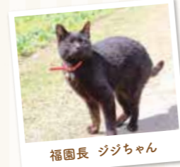
福園長 ジジちゃん

☎0994-46-5627 鹿屋市小薄町4994-2 営業 / 9:00～17:00 https://damask-wind.com/ Instagram / @damasknokaze