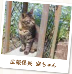
広報係長 空ちゃん

園内には3匹の看板ねこちゃんがあります。取材時には、2匹のねこちゃんと会うことができました！