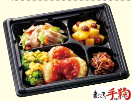
※写真は1人用の献立例のイメージです。